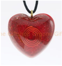
Orgone Hanger Ruga Koro